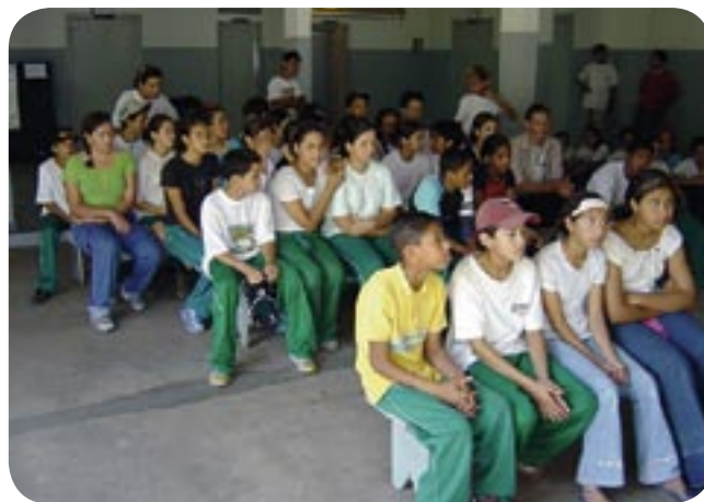
→ REUNIÃO DE MOBILIZAÇÃO DOS JOVENS.

foi semelhante. Apresentação dos participantes, explicação sobre o Conselho Gestor da APA e sobre o Projeto de Gestão Participativa. Discussão sobre o papel dos jovens neste projeto e por fim a seleção dos Agentes Jovens para participar das capacitações. Em Tagaçaba foi realizada no dia 13 de agosto na Escola Estadual de Tagaçaba. Na comunidade do Batuva aconteceu no dia 21 de agosto na fábrica de processamento de banana. Na Barra de Superagui foi realizada no dia 24 de agosto na Associação das Mulheres. Na Ilha Rasa e Almeida foi no dia 26 de agosto na lanchonete da Ponta do Lanço. Na Vila das Peças foi realizada no dia 31 de agosto na Associação de Moradores. Na comunidade de Ipanema aconteceu na escola da comunidade no mesmo dia que a Vila das Peças. Na sede de Guaraqueçaba aconteceu no dia 31 de setembro no Centro de Visitantes do IBAMA. Em Tagaçaba estavam presentes cerca de 150 pessoas das comunidades, na Vila das Peças cerca de 50 pessoas da comunidade e na Barra de Superagui participaram 40 pessoas da comunidade.