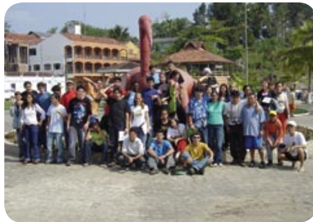
→ PARTICIPANTES DA OFICINA DE CAPACITAÇÃO DOS AGENTES JOVENS.

Foram selecionados cerca de trinta jovens durante a mobilização dos jovens que ocorreu em agosto. Estes representaram suas respectivas bacias hidrográficas nas oficinas de capacitação de Agentes Jovens, organizadas pela ABDL (Associação Brasileira para o Desenvolvimento de Lideranças) e apoiadas pelo IBAMA. As duas reuniões dos jovens foram realizadas durante os dias 17 à 19 de setembro e 24 à 26 deste mesmo mês. Foram feitas diversas atividades e dinâmicas de grupo para aproximar os participantes, demonstrar de forma prática a importância do trabalho cooperativo e participativo. Desta forma abriu-se caminho para que eles discutissem questões referentes às suas comunidades e sua inserção na APA de Guaraqueçaba.