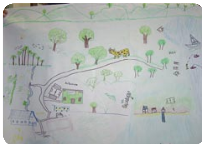
→ MAPA DA REGIÃO DE PIAÇAGUERA DESENHADO PELOS JOVENS.

Uma das atividades envolveu o questionamento sobre um problema comum ao dia a dia destes jovens, o grande número de faltas de alguns alunos na escola. A atividade chamou-se “Diagnóstico Participativo na Escola”. Entre o grupo de Agentes Jovens e agentes locais foi definido quem seriam os alunos, quem seriam os professores, os