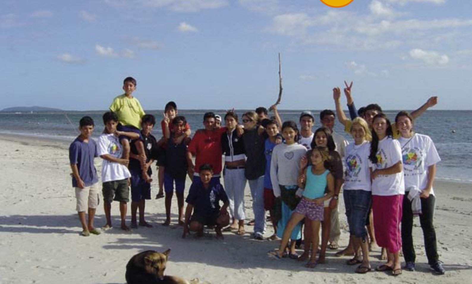
→ PARTICIPANTES DA GINCANA NA ILHA DAS PEÇAS.