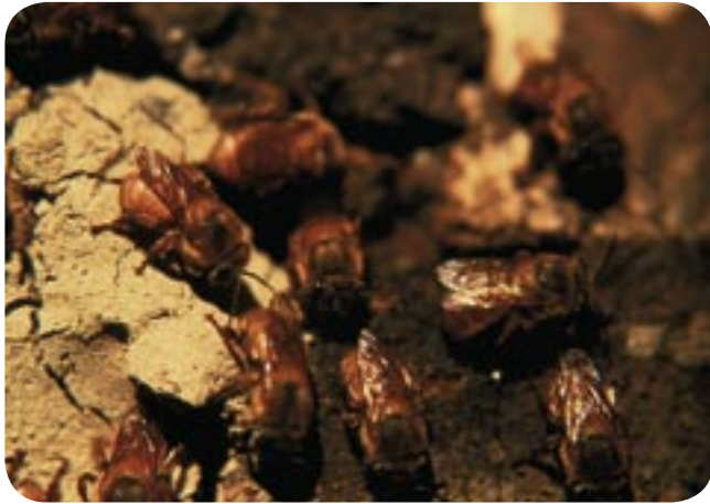
→ Rufiventris ( Melipona rufiventris ).

colônia em risco. Então é muito importante que as pessoas interessadas em criar abelhas nativas procurem quem as conhece e aprenda a fazer da maneira certa.