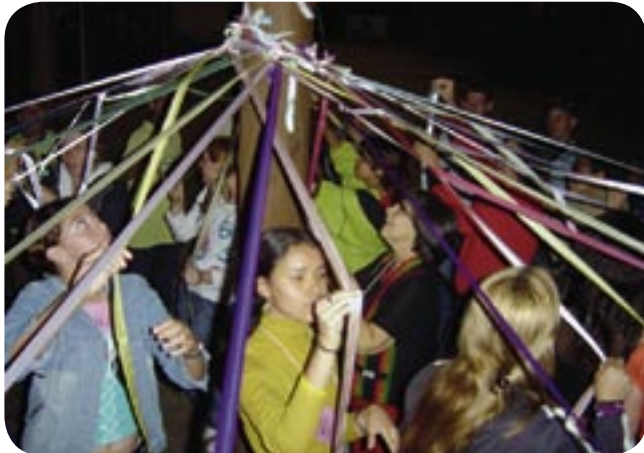
→ ATIVIDADE DURANTE CAPACITAÇÃO DOS JOVENS.

funcionários, os pais dos alunos, o conselho tutelar e o diretor. Cada grupo formulou suas razões, suas justificativas e exigências a respeito desta problemática. Através da encenação representada pelos agentes discutiu-se este problema para alcançar soluções para as causas e não para as conseqüências do problema. A falta de vontade de assistir às aulas foi uma das conseqüências. As aulas que não abriam espaço para os alunos discutirem e se divertirem ao aprender foram uma causa para esta falta de vontade dos alunos. E como solução para esta causa se propôs que fizessem uma