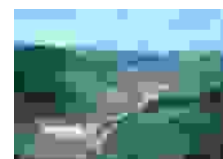
Rio Paraíba do Sul