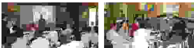
Oficina Regional do projeto na sede do CN-RBMA, São Paulo, 2007.